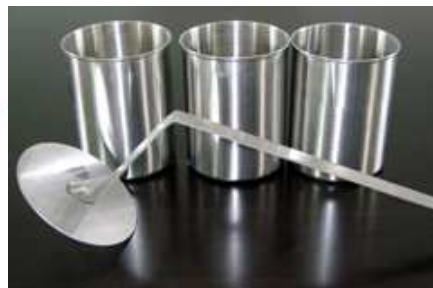
Typy hořáků - nálevek